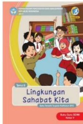
Gambar 4. Sampul Buku Guru Tema 8 Lingkungan Sahabat Kita

Menampilkan gambar terlebih dahulu kemudian keterangan. Jarak antara gambar dengan keterangan diberi spasi satu. Setiap awal kata selain kata hubung menggunakan huruf kapital. Posisi gambar berada di tengah.